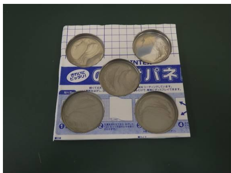
図1 実証試験用試料の外観

※汚染が付着した実証試験用試料を4種各1枚、汚染が付着していない実証試験用試料を4枚製作