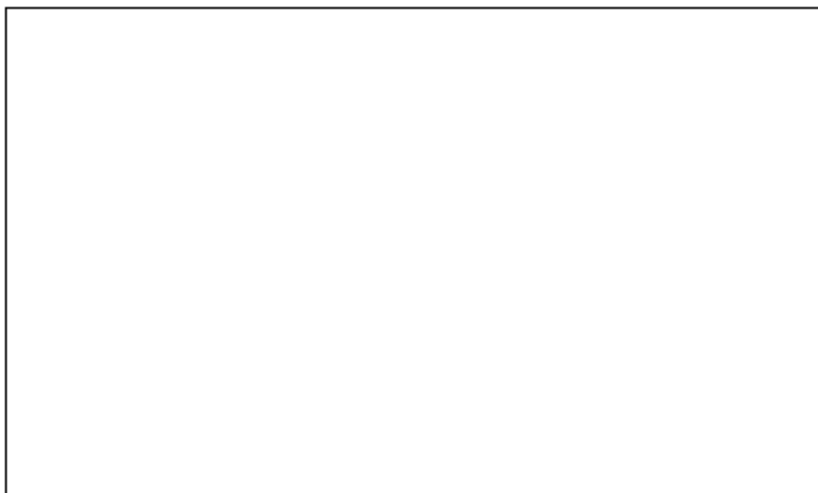
別紙1-1図 設計荷重（作用幅分による比較）