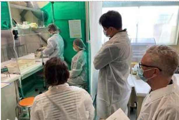
海底土試料について、乾燥器による乾燥、ヘラによる粉碎、2mm及び0.25mmのふるい分けを行った後、二分器による試料分割を行っている様子

Taking out a sediment sample from a grab sampler.