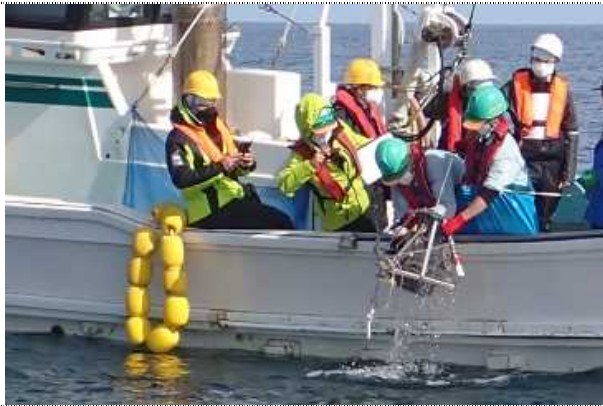
東京電力福島第一原子力発電所沖で採泥器により海底土試料を採取しているところ

Collecting a sediment sample by a grab sampler off the coast of TEPCO's FDNPS.