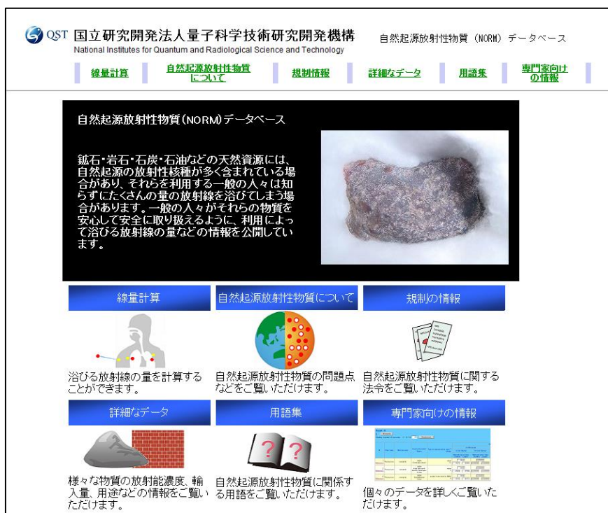
図 4. 量研の自然起源放射性物質 (NORM) データベース

得られた成果をウェブサイトで公開することは、研究成果を広く一般社会に還元するためにも重要と考える。近年、量研の NORM データベースが開発され（図 4）【量研, NORM データベース, 2021】、これを活用して情報の公開を検討することは非常に有効な手段と考える。この NORM データベースは 1 日に 10-30 件程度のアクセスがあり、NORM に関連する研究情報を社会に提供するための WEB ツールとして運用されている。