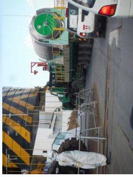
キャスク移動状況(63基目) 撮影日：平成26年11月19日