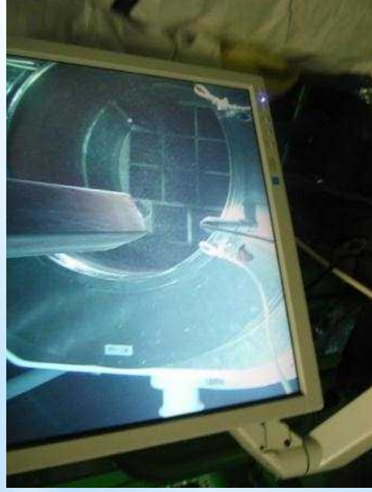
曲がり燃料充填状況(1343体目) 撮影日：平成26年10月31日

使用済燃料の落下やそれを取り出す際のかじりなどの当初懸念されていたトラブルは発生せず完了。