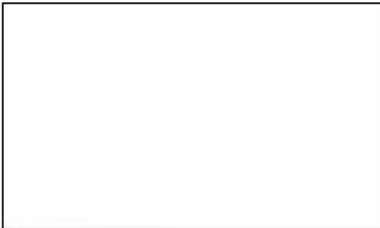
別紙 3-1 図 中性子遮蔽材の質量減損データ (註) (自社開発品 [MREX レジン] 及び NS-4-FR (1) )

前頁に示した中性子遮蔽材（エポキシ系樹脂）の質量減損率算定式 (1) の基となる質量減損データと MSF-24P 型の中性子遮蔽材（エポキシ系樹脂、自社開発品）の質量減損データを重ねたものを別紙 3-1 図に示す。図に示すとおり、両者の質量減損率は同等であり、文献の質量減損率算定式を用いることは妥当である。