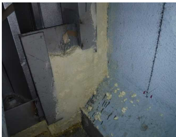
【写真9】 隙間をシール材、発泡剤等で密封