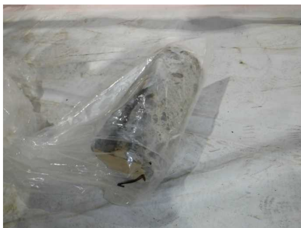
【写真6】 抜き出したコア