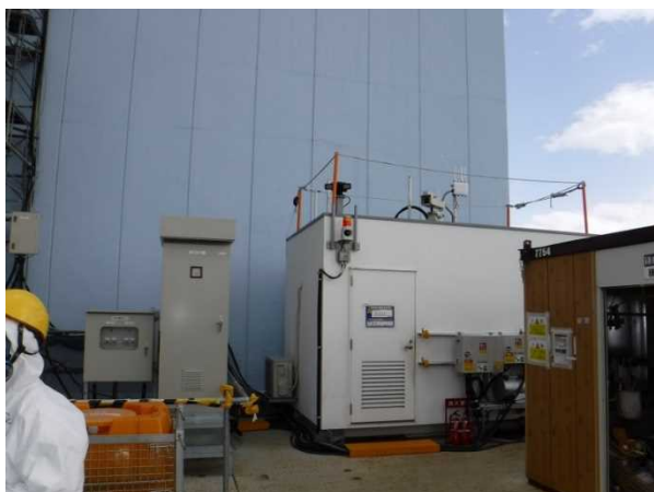
【写真3】作業員退避小屋