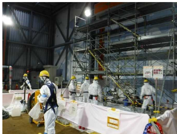
【写真2】前室内部 作業準備