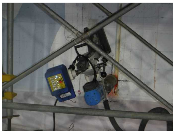
【写真7】 コア埋め戻し中