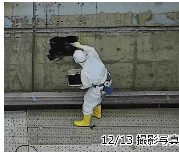
剥離除染剤塗布の状況