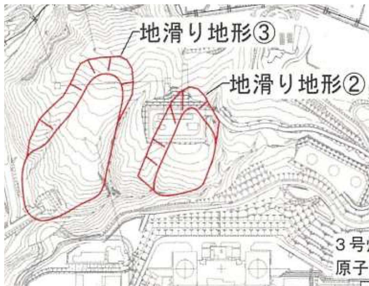
図-2 地滑り地形②及び③の位置