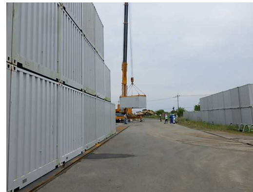
積み直し作業実施状況