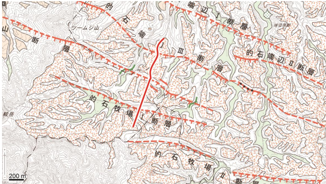
図 2 浅層反射法地震探査地域（調査測線沿い）。ベースマップは鈴木ほか（2017）及び地理院タイルを使用。