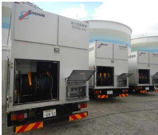
高圧発電機車配置