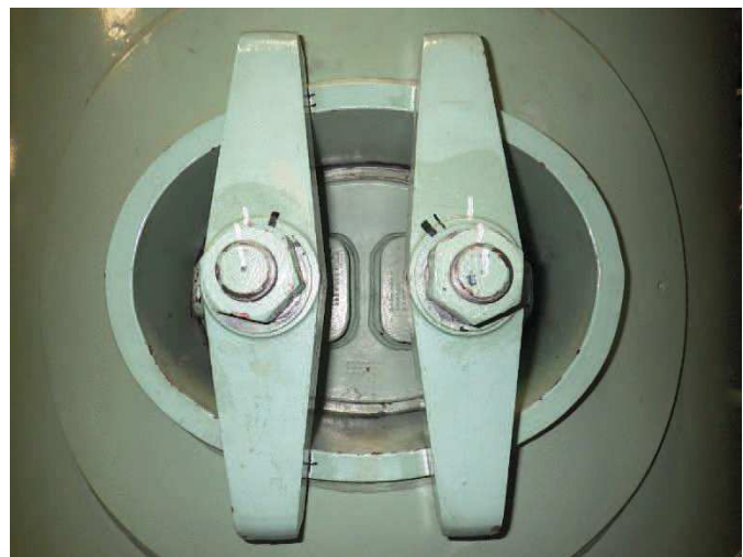
図 4-1 マンホールカバー概要図