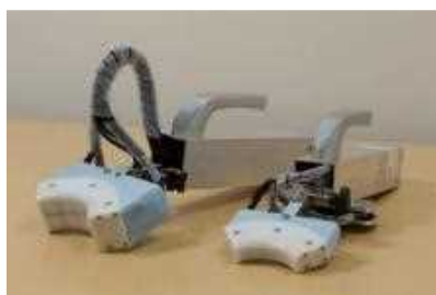
（左）成人用 （右）小児・乳幼児用