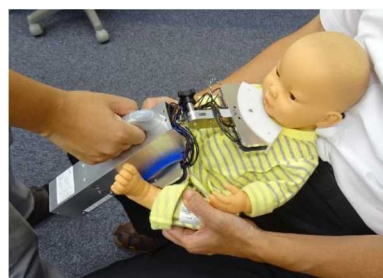
乳児測定のイメージ