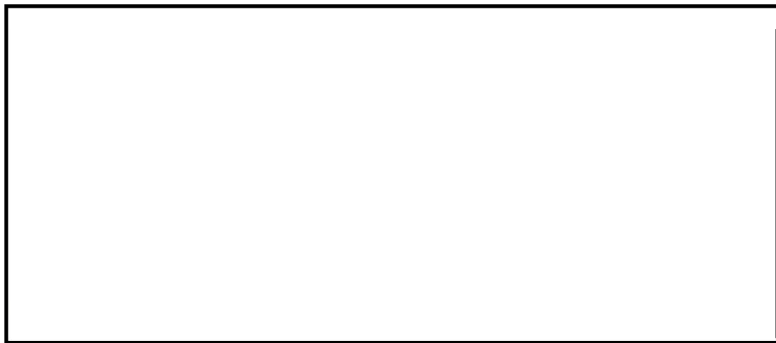
図 4-2 計算モデル図(長辺方向転倒)