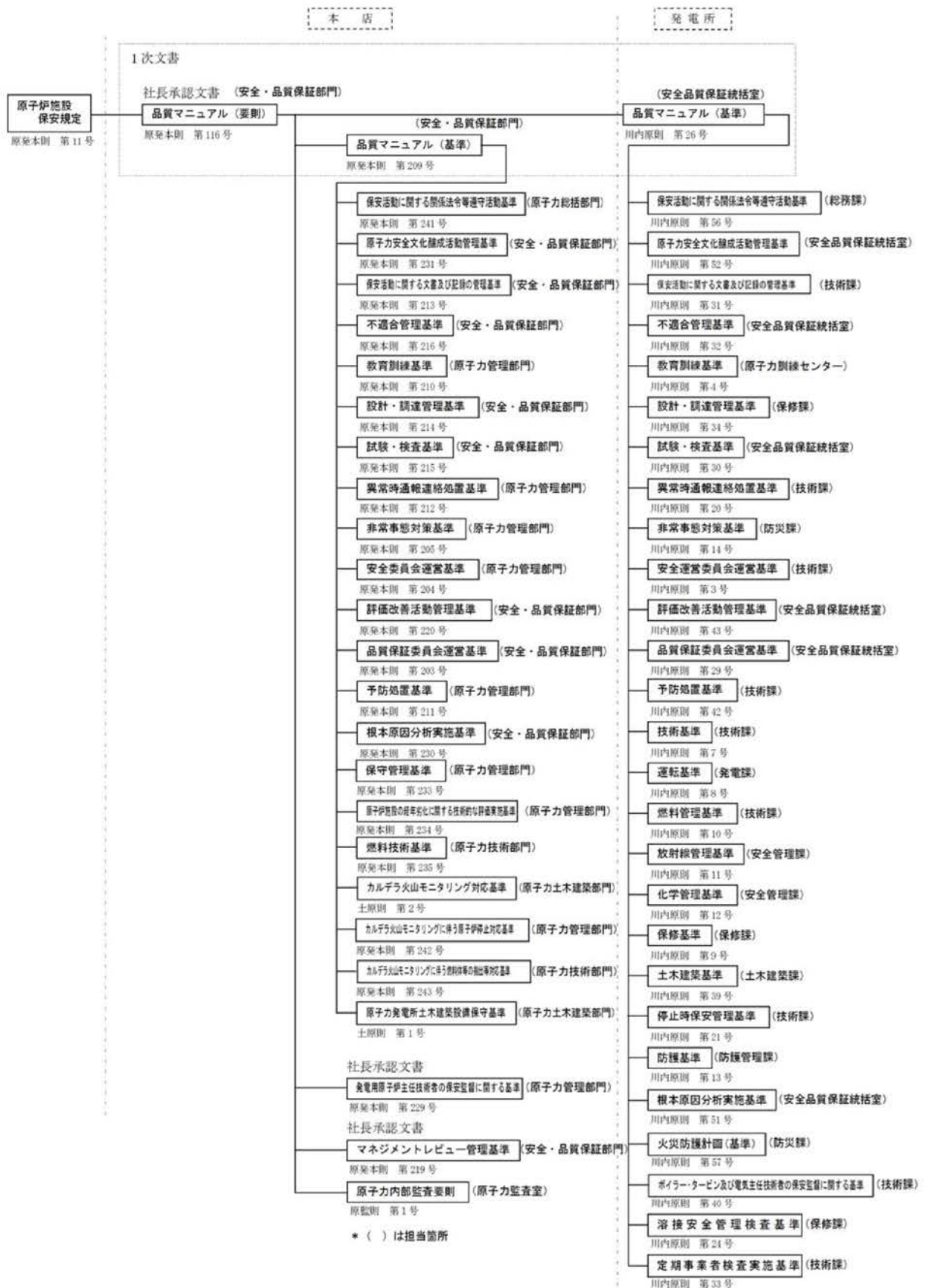
第1.17-1図 品質保証計画に係る規定文書体系図