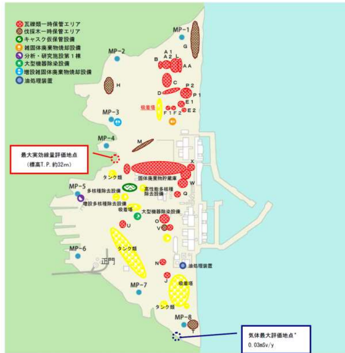
図 2. 2. 2-2 敷地境界線上の最大実効線量評価地点