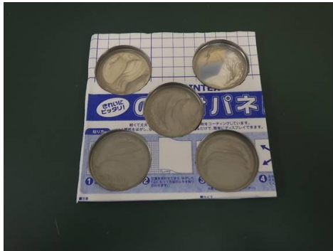
図1 実証試験用試料の外観

※汚染が付着した実証試験用試料を4種各1枚、汚染が付着していない実証試験用試料を4枚製作