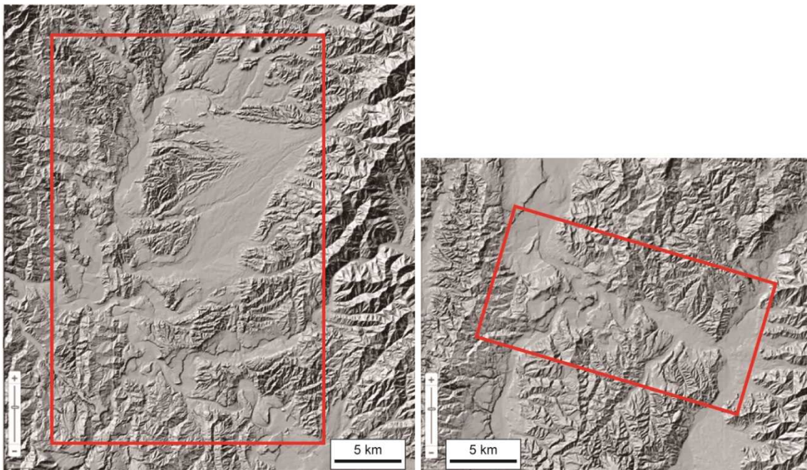
図 1 地形分類図作成範囲 (赤枠内に分布する地形面)。左図：新庄盆地、右図：魚野川流域。ベースマップは国土地理院 Web 陰影図を使用。

・地形分類図は、ドローソフトを用いてトレースし、ベクターファイルを作成する (ファイル形式は.ai)。