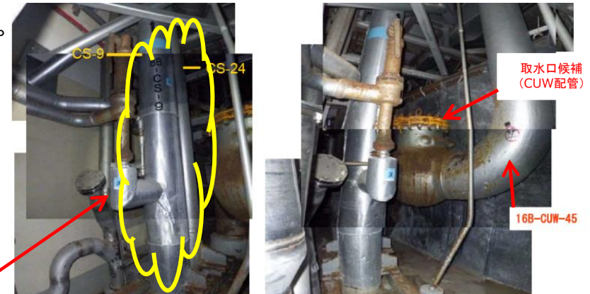
現場配管状況 (下図矢印より見る)