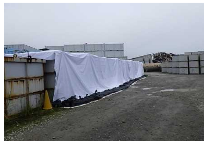
図4 タンクの養生後